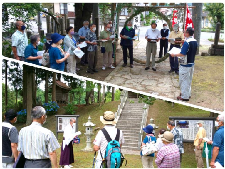
写真上：松澤神社（千厩町千厩前田） 写真下：櫻森神社（千厩町奥玉町下）

合わせて受講生は、神社の正しい参拝方法や神様に願いを伝える作法とマナーを学びました。